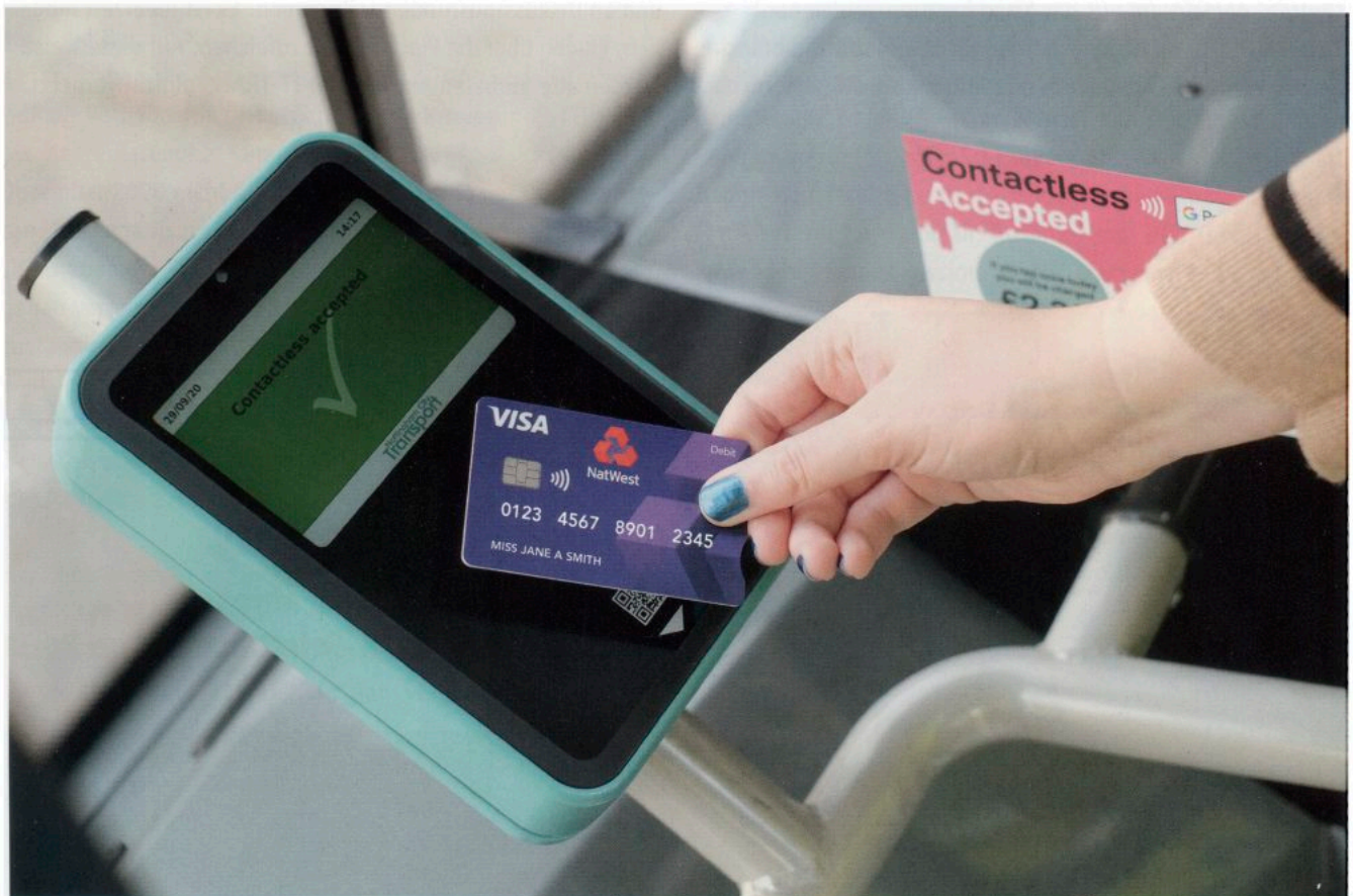
INIT bietet verschiedene Optionen, um bargeldloses Bezahlen schnell und unkompliziert einzuführen.

Pandemie zu bewältigen und gleichzeitig weiterhin die Zukunft der Mobilität voranzutreiben.