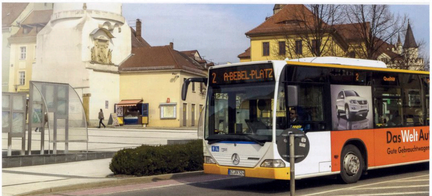
Mobile Tickets werden von den Kunden des ZVON so gut angenommen, dass die Fahrscheinautomaten komplett abgeschafft wurden.

Dieser Pioniergeist hat sich ausgezahlt – mobile Tickets sind beim ZVON mittlerweile der Standard. Das Ticketsortiment, das der Verkehrsverbund seinen Kunden über diesen Vertriebskanal anbietet, umfasst aktuell Einzelfahrscheine, Tageskarten und Fahrradtageskarten sowie Seniorenmonats-, Monats- und Wochenkarten im Nicht-Abo-Modell. Die Fahrgäste haben darüber hinaus die Möglichkeit, innerhalb einer einzigen App auch die Fahrscheine der anderen Regionen zu buchen, die an HandyTicket Deutschland teilnehmen. Die Reisenden des ZVON profitieren dabei von einem unkomplizierten Ticketkauf, der im Vergleich zum analogen Erwerb überall, jederzeit und ohne Bargeld möglich ist. Das Kundenportal bietet ihnen dabei absolute Transparenz: Dort können sie ihre Ticketkäufe jederzeit übersichtlich nachvollziehen, Quittungen beispielsweise für eine Reisekostenabrechnung ausdrucken oder Account- und Benutzerdaten ändern.